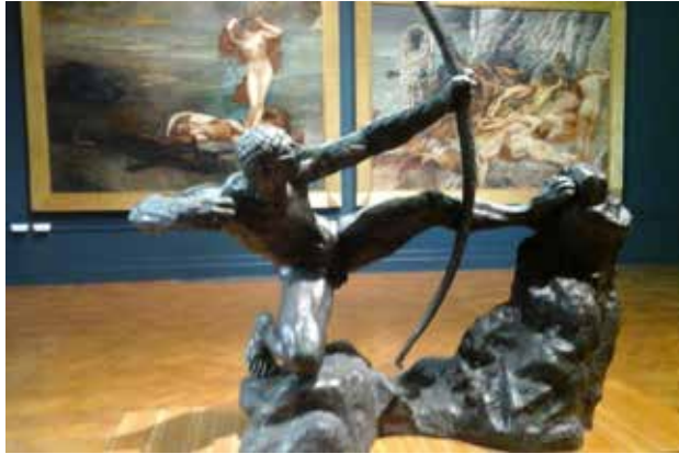
Rysunek 1. Przykład rysunku